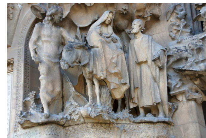
Fassade: Geburt Christi

Die Fassade der Geburt Christi ist besonders bemerkenswert. Sie zeigt detaillierte Skulpturen, die die Weihnachtsgeschichte darstellen, einschließlich der Geburt Jesu, der Anbetung der Hirten und der Heiligen Familie. Die Figuren und Reliefs sind lebendig und expressiv, und sie verleihen der Fassade eine unglaubliche Lebendigkeit und Dynamik. Die Fassade der Passion ist ein Kontrast zur Fassade der Geburt Christi. Sie ist geprägt von scharfen Linien und einer eher düsteren Ästhetik, die die Leidensgeschichte Jesu Christi widerspiegelt. Hier finden sich Darstellungen der Kreuzigung, der Geißelung und anderer wichtiger Ereignisse aus dem Leben von Jesus.